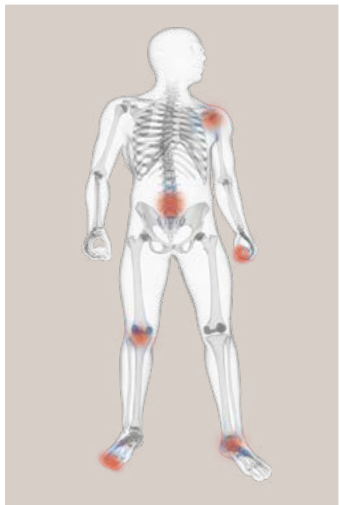
Figura 1. Articulaciones afectadas por la artritis psoriásica