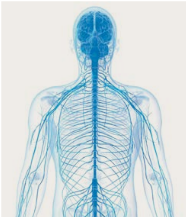
Figura 1. El sistema nervioso central

Se cree que la EM es una enfermedad inmunomediada. Esto significa que ocurre debido a un problema en el sistema inmunológico. Normalmente, el sistema inmunológico busca y ataca bacterias o virus que pueden causar enfermedades. En la EM, el sistema inmunológico ataca por error al SNC. 1